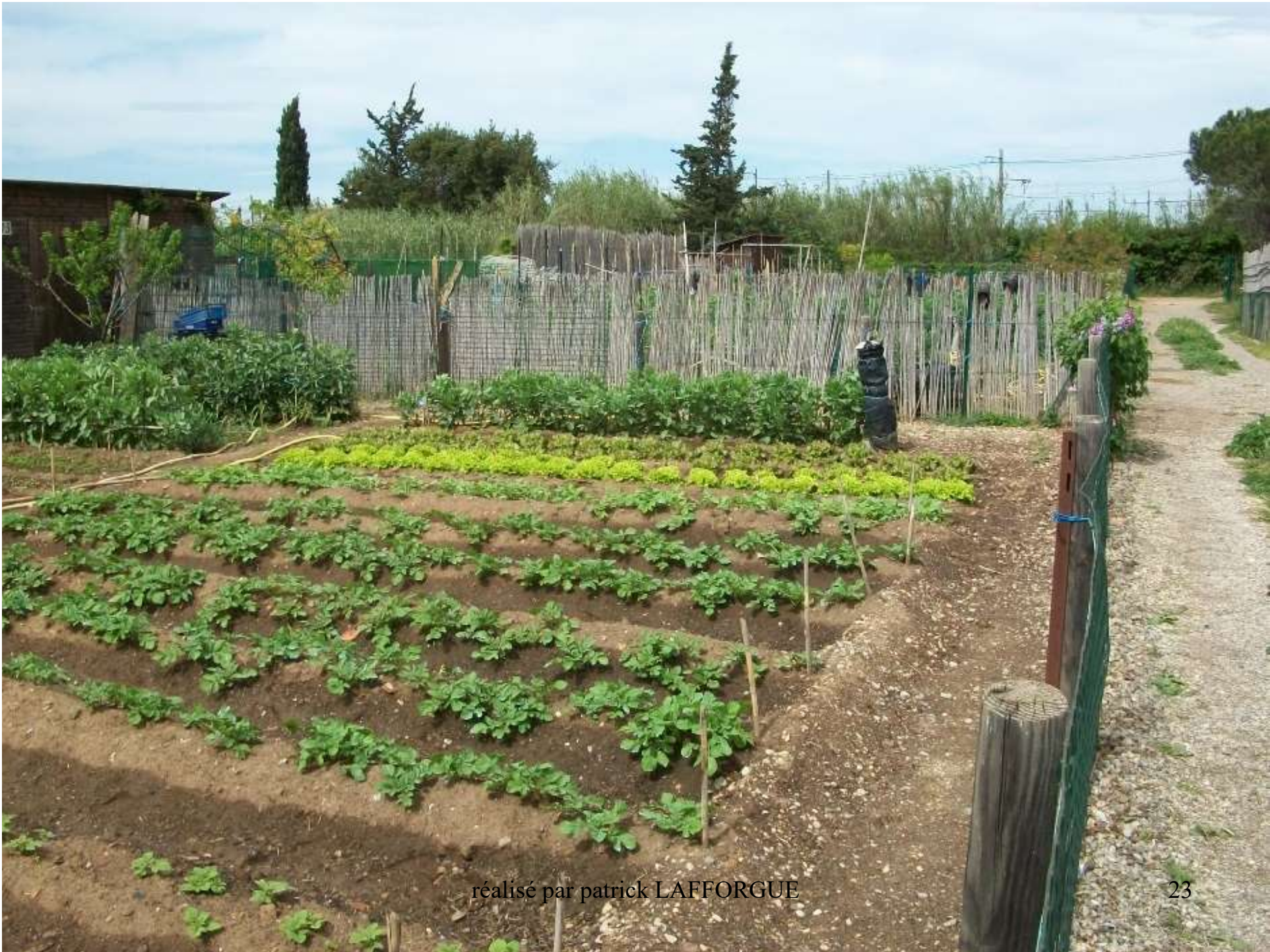
réalisé par patrick LAFFORGUE