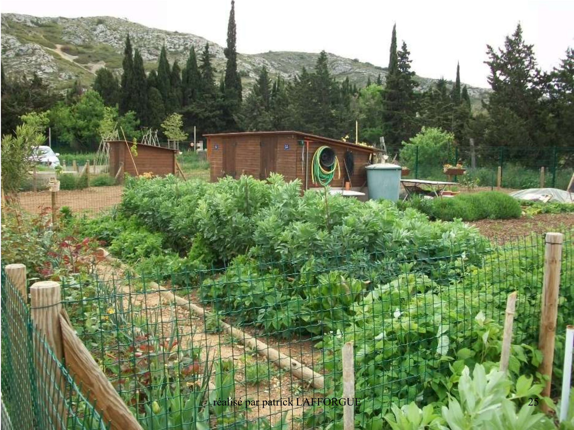
réalisé par patrick LAFFORGUE