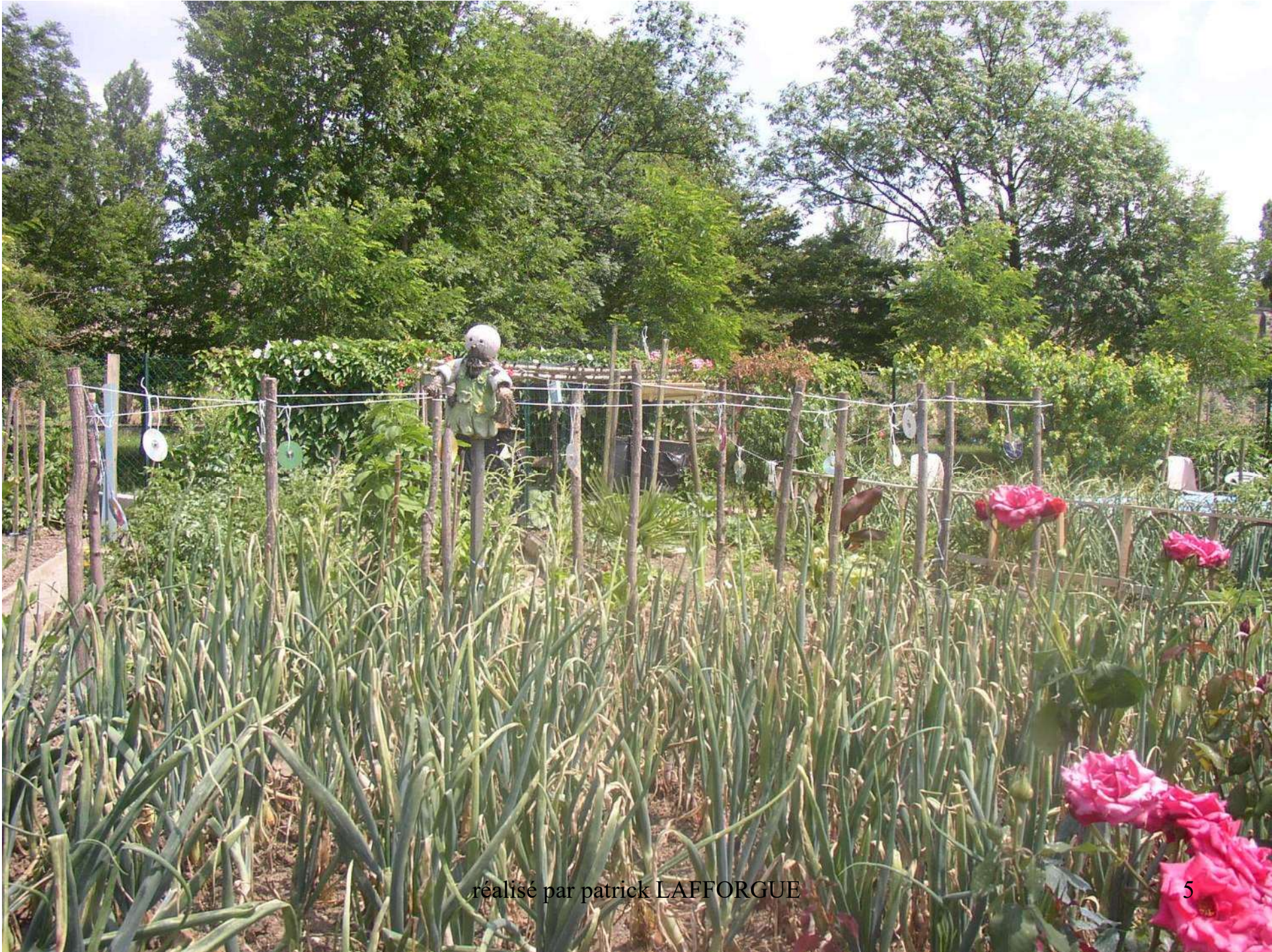
réalisé par patrick LAFFORGUE