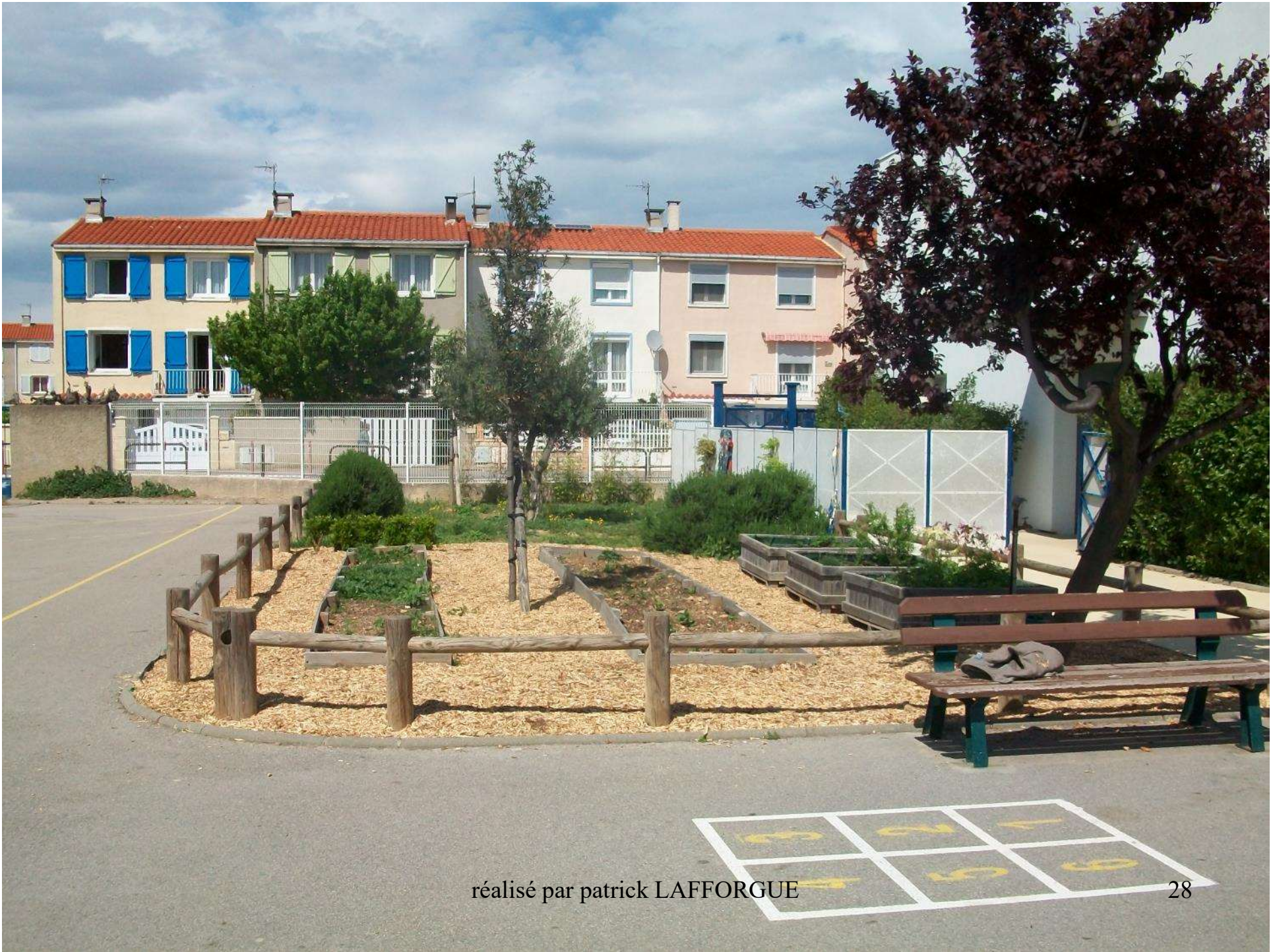
réalisé par patrick LAFFORGUE