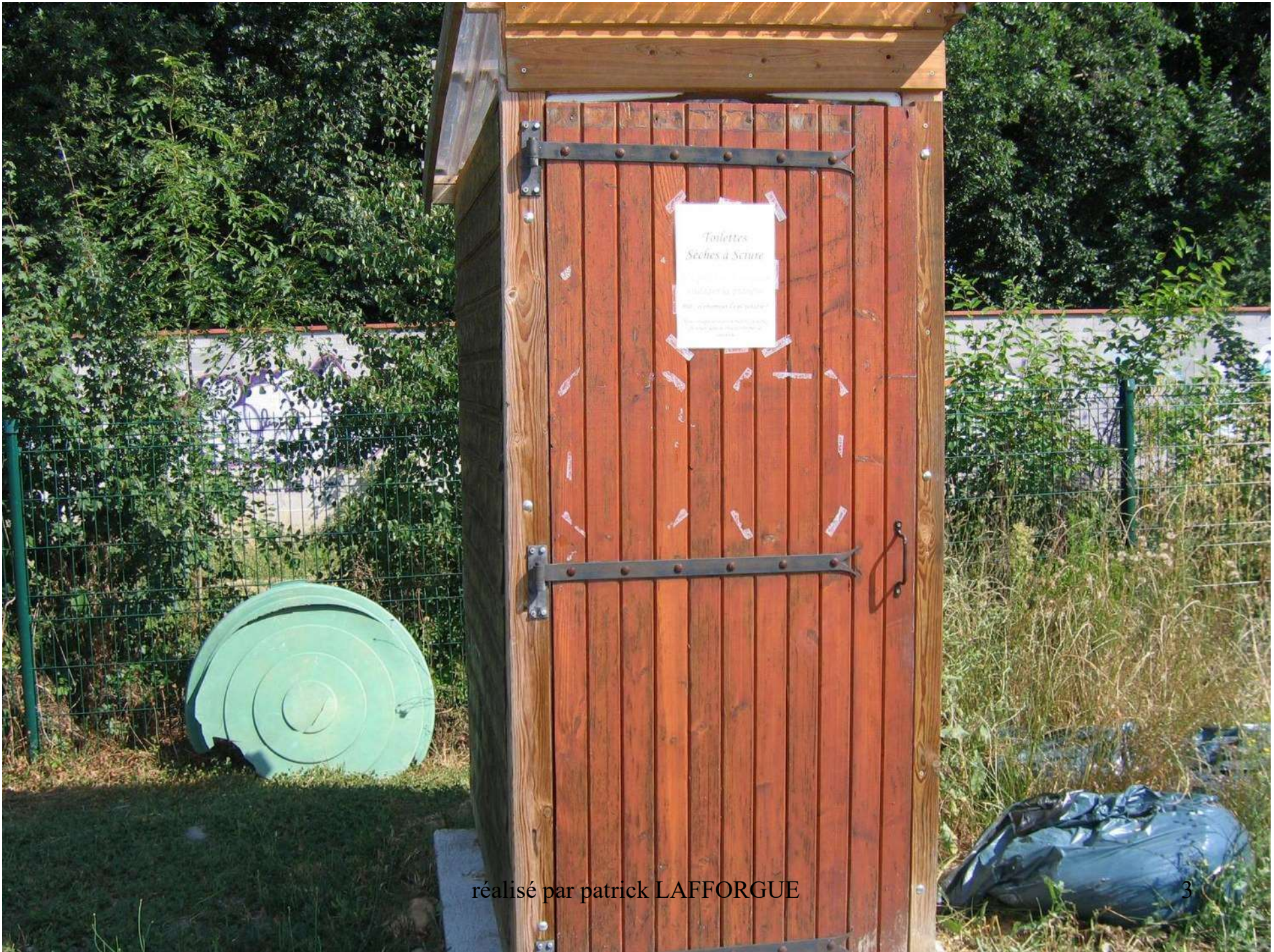
réalisé par patrick LAFFORGUE