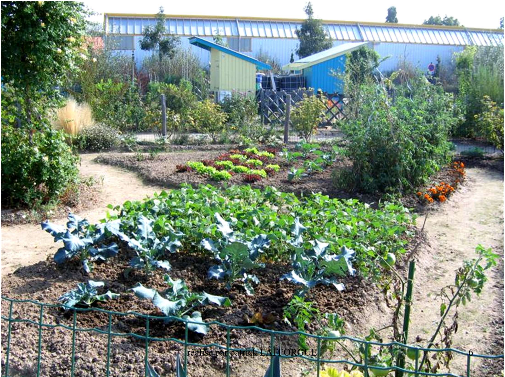
réalisé par patrick LAFFORGUE