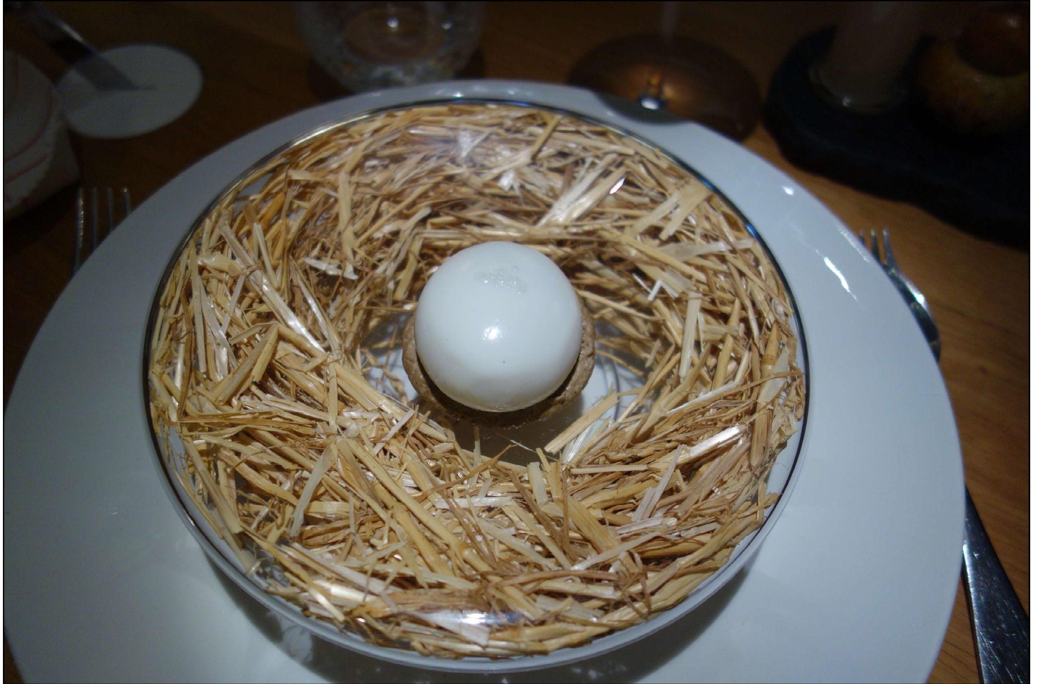
Arrivée de L'oeuf poule « Carrus » pourri de truffes mélanosporum.