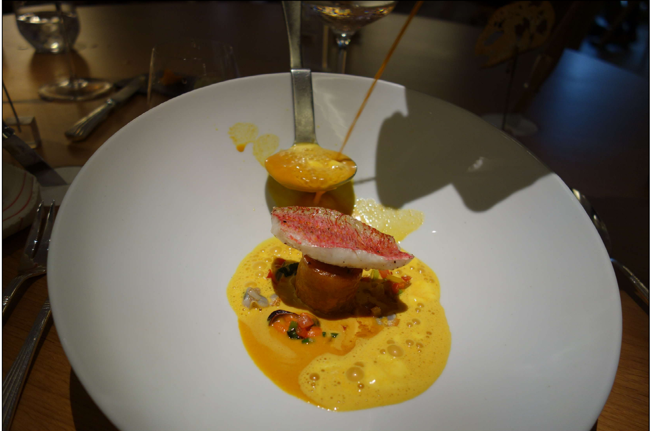
Ecume de rouille au safran préparée à table.