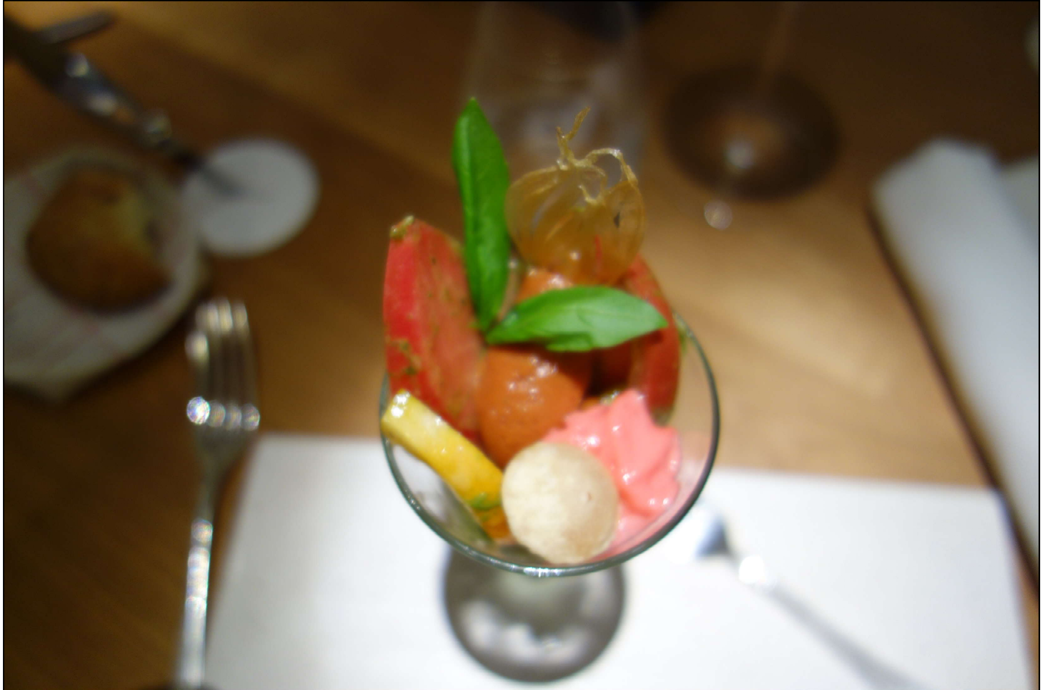
Différentes variétés de tomates avec un sorbet tomate basilic.