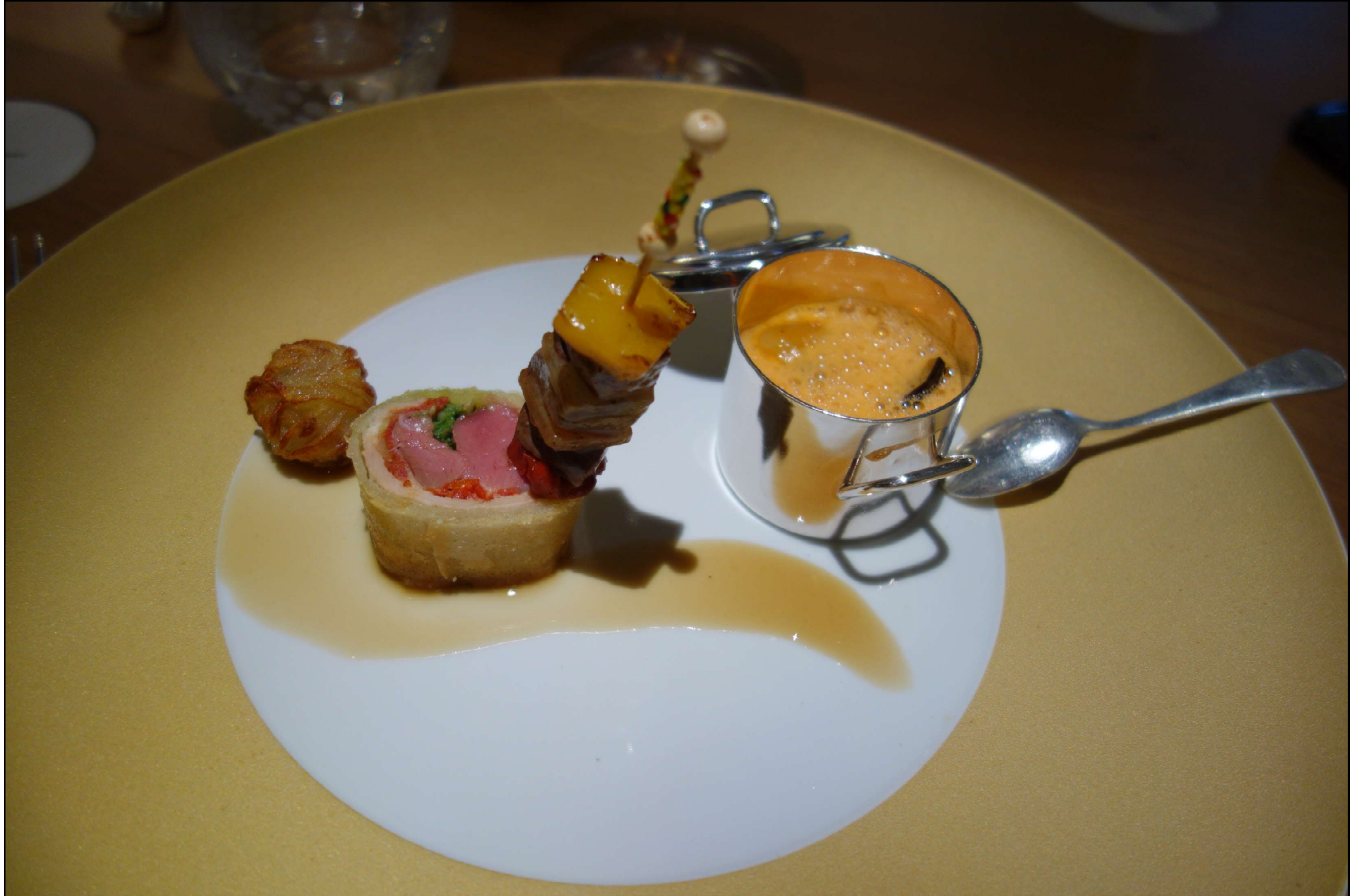
Selle d'agneau « el xai catalan » en fines feuilles croustillantes, brochette de b eatilles, cassolette en « rougette » estivale aux poivrons