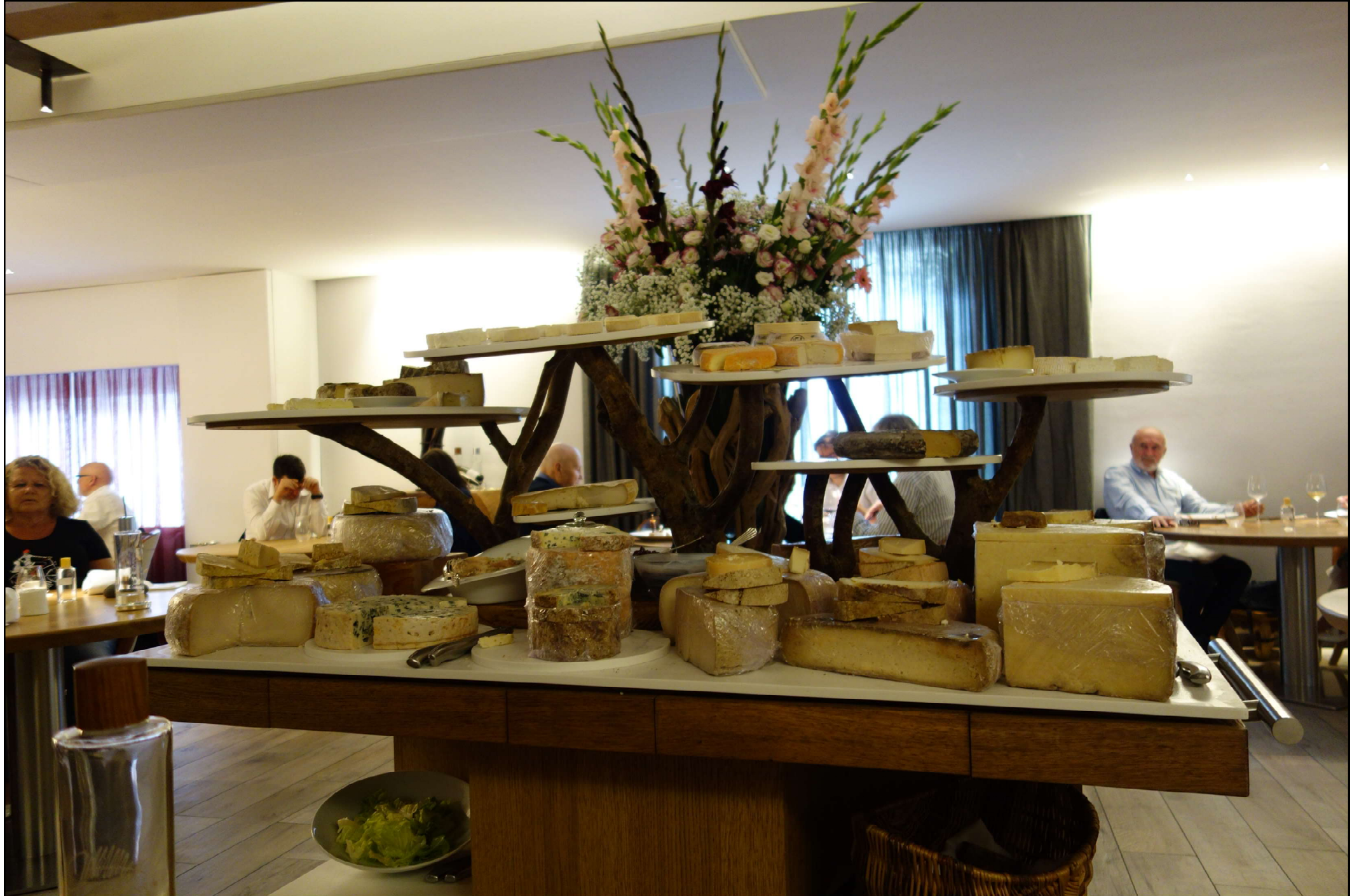
Chariot de fromages, affinés surtout des Corbières...mais aussi d'ailleurs.