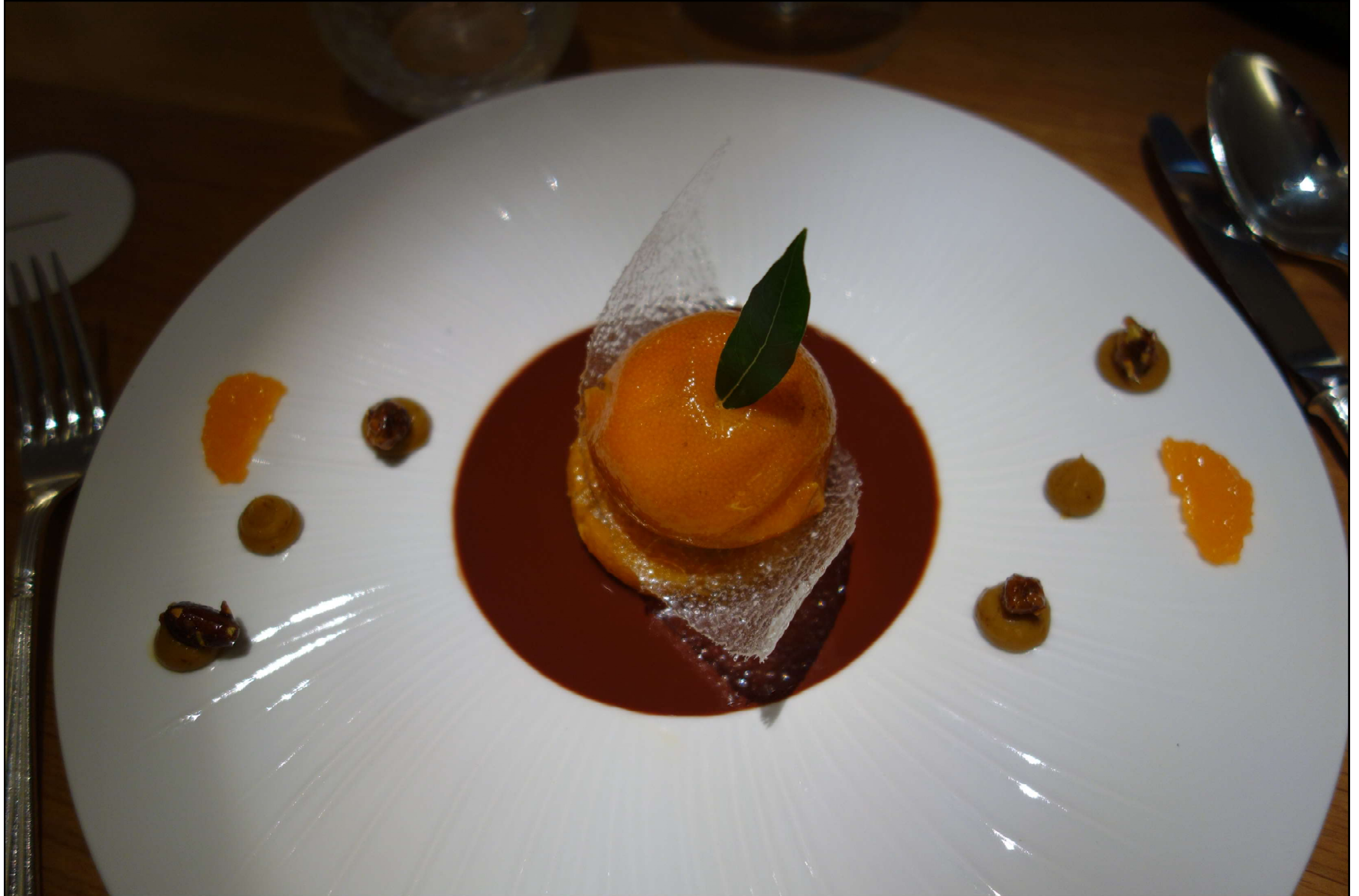
Sorbet de clémentine en peau semi confite, suprême en tartare, feuillantine au chocolat et crème pralinée pistache.