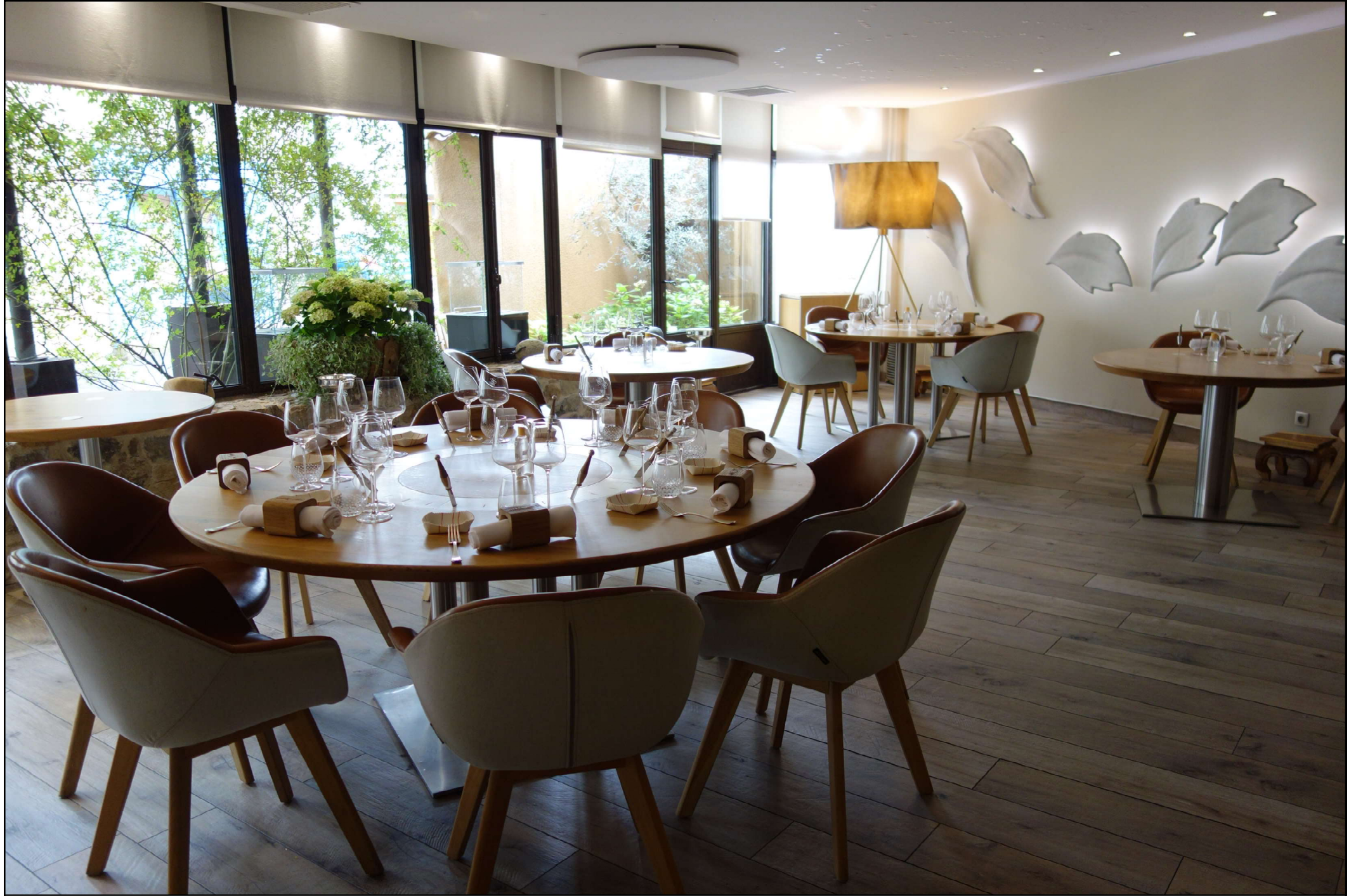
La salle principale.