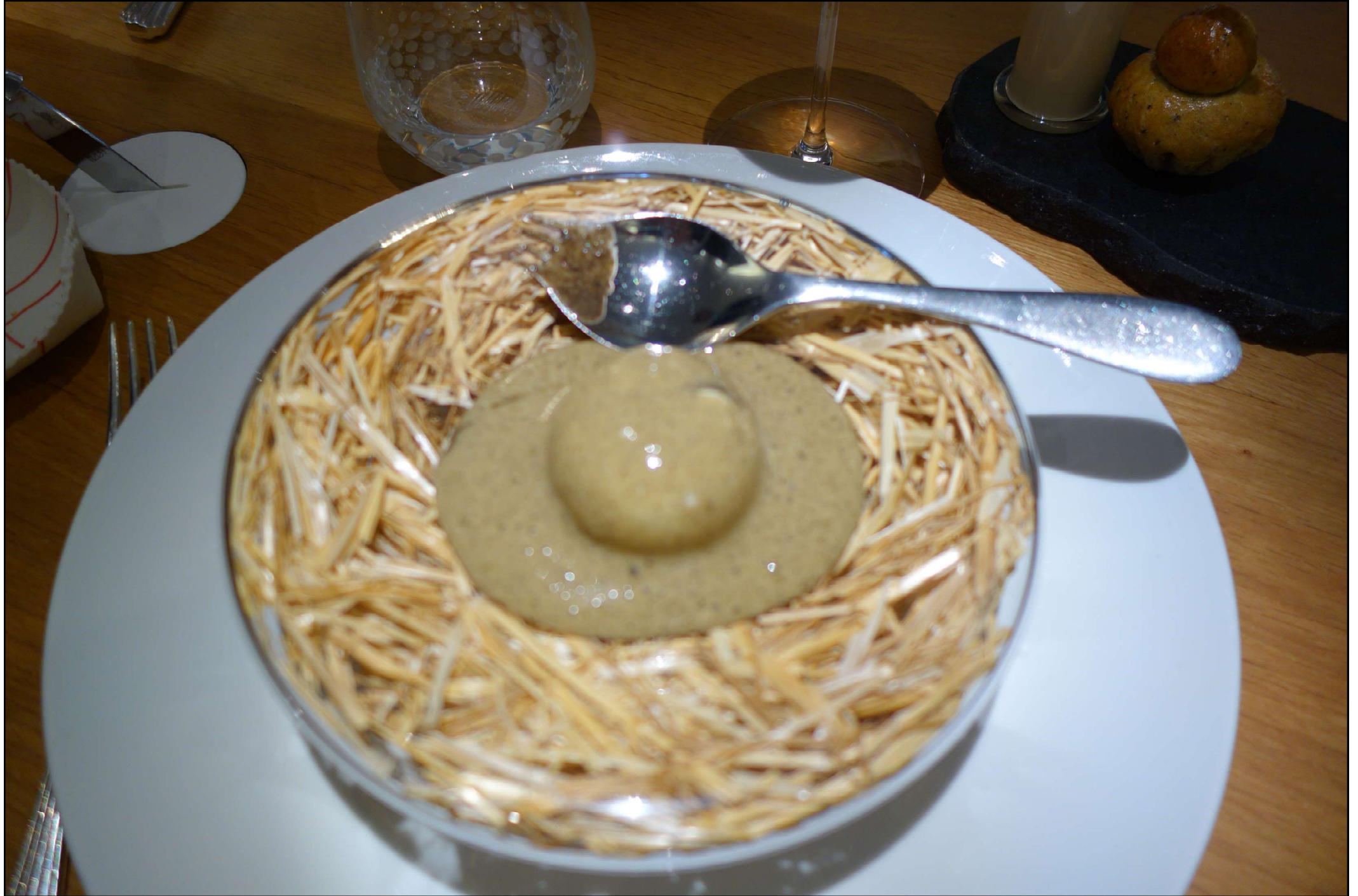
sur une purée de champignons