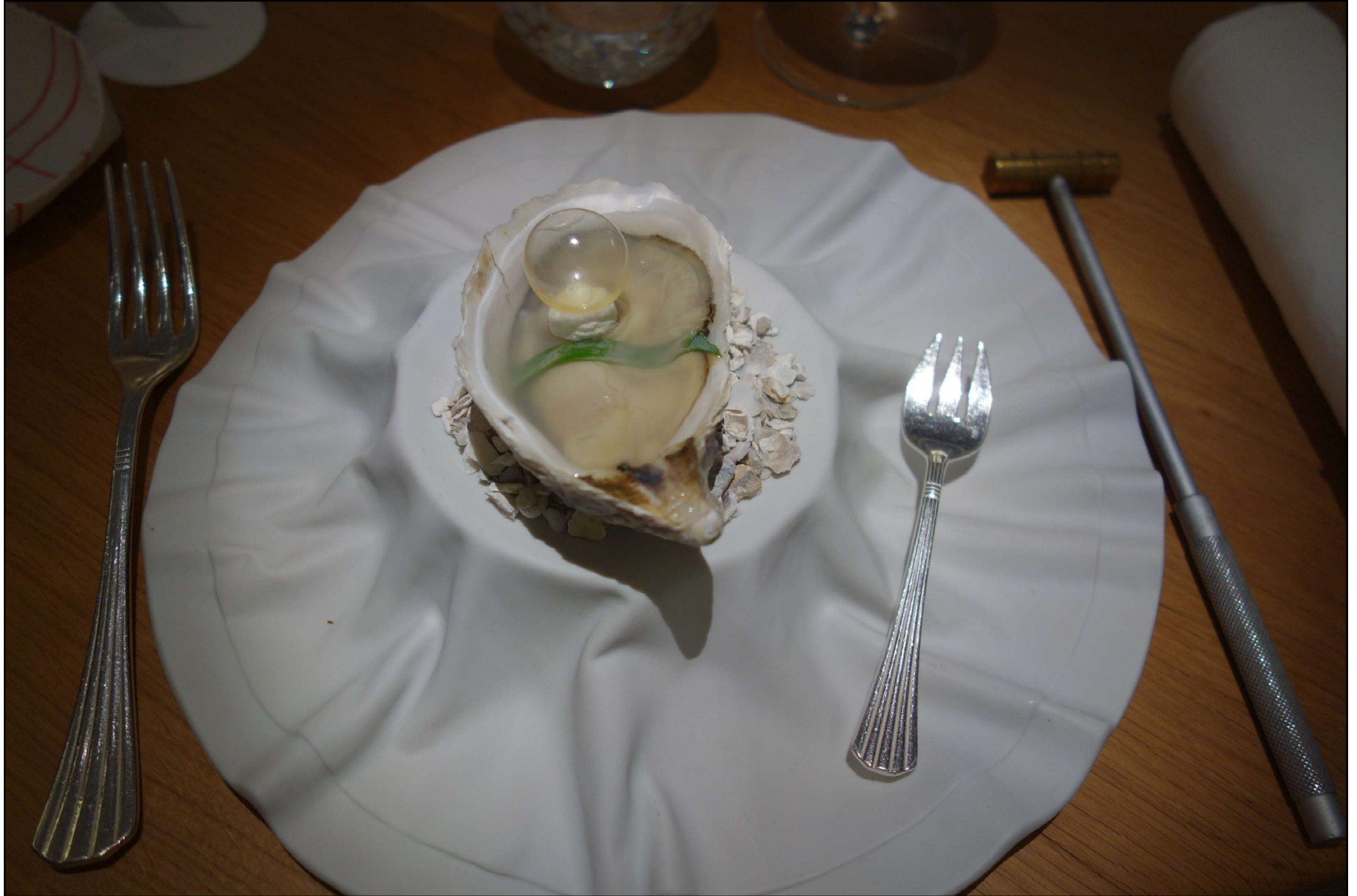
Huître Tabouriech perlée, fumée au bois de hêtre en gelée de son eau.