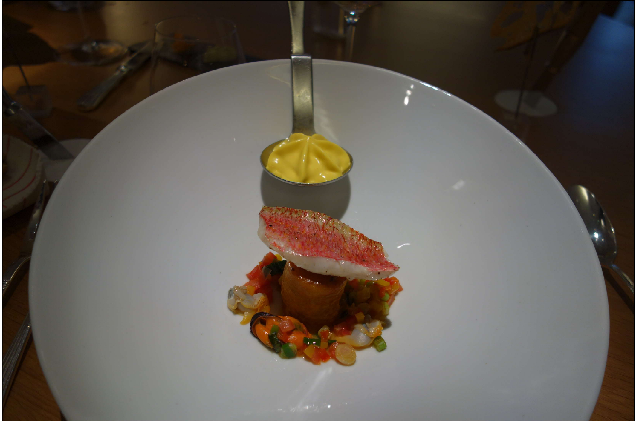
Le filet de rouget barbet, pomme bonne bouche fourrée d'une brandade à la cébette en « bullinada », écume de rouille au safran.