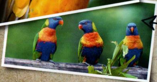
Des Loriquets, des aras, des ibis des conures... des flamants des Caraïbes !