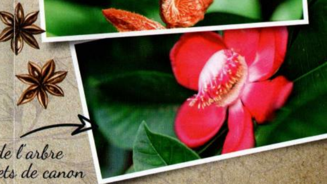
Les fleurs de l'arbre à boulets de canon