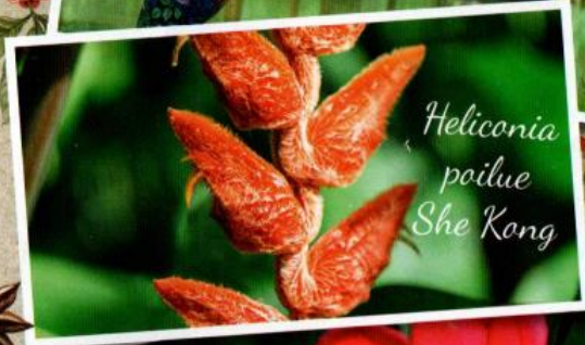
Heliconia poilue She Kong