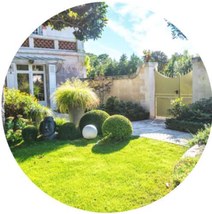
Gamme aménagement de jardin