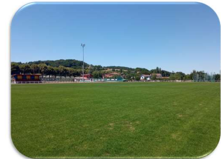
Gamme fertilisation et soins