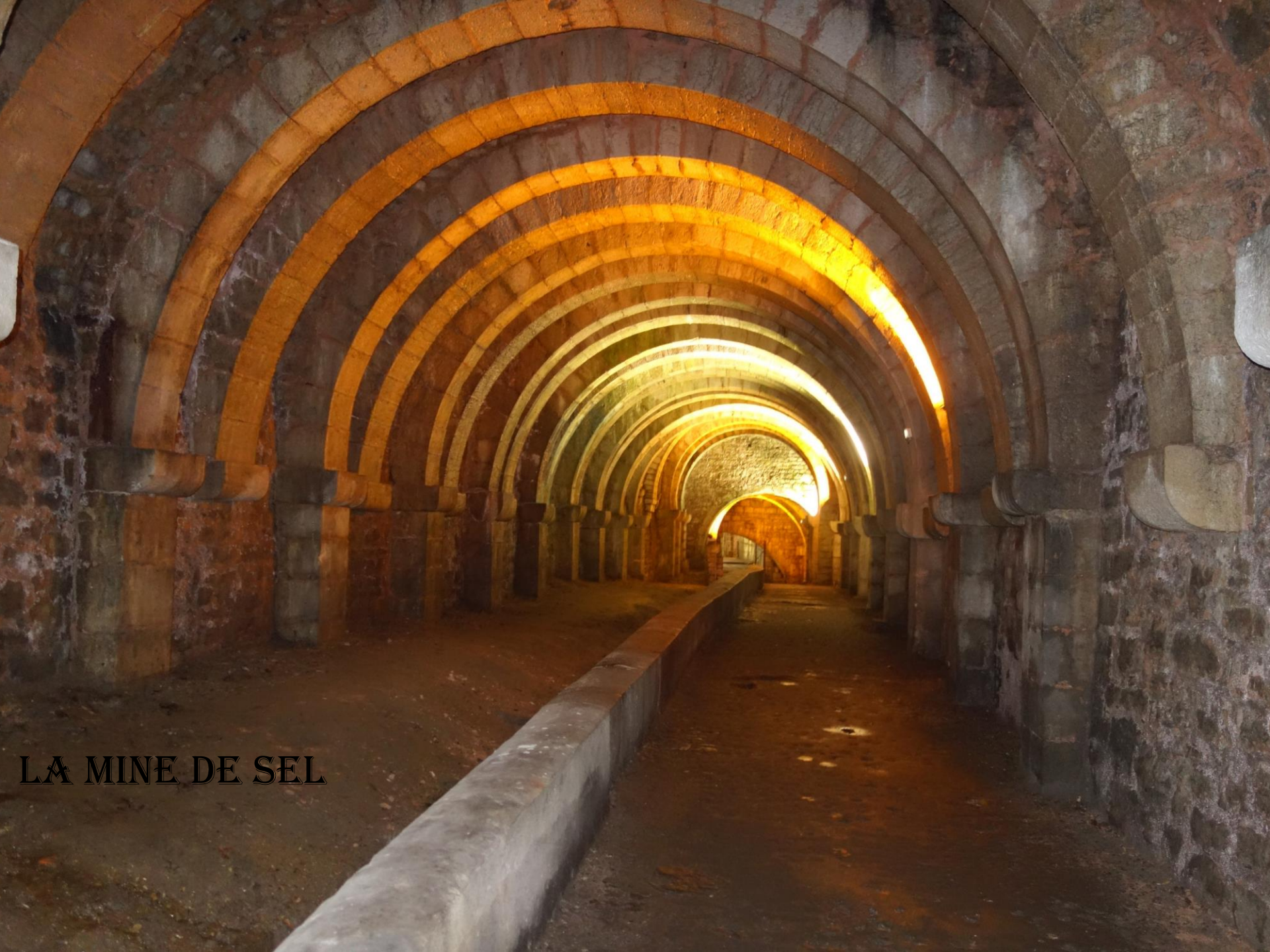
LA MINE DE SEL