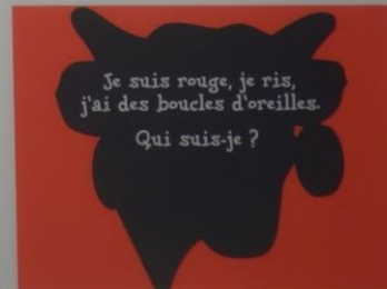
Affiches publicitaires de la campagne « Sacrée Vache qui rit », 1993.