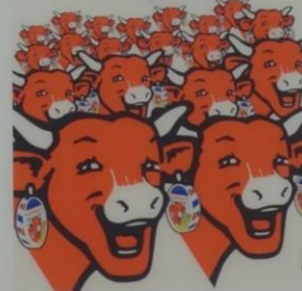
Affiches publicitaires de la campagne « La Star du Fromage », 1985.