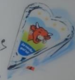
Sacrée Vache qui rit !

ON REVIENT TOUJOURS À SES PREMIÈRES AMOURS.